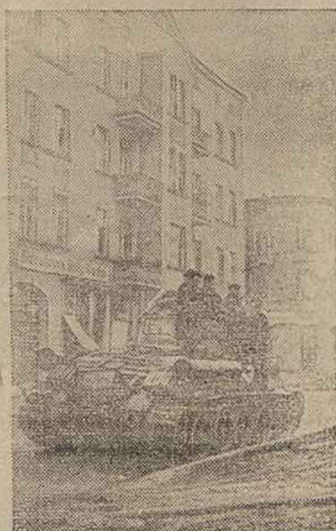
На вуліцах нямецкага горада Штольп, занятага нашымі войскамі