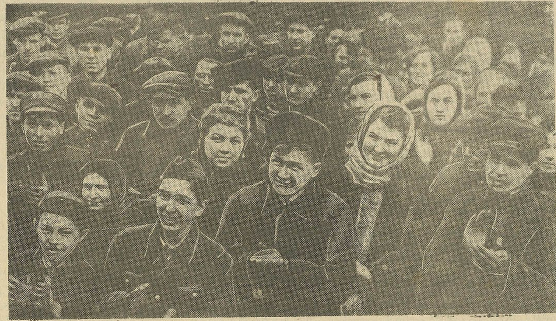
На мітынг калектыва мінскага станкабудавальнага завода імя Кірава, прысвечаным выпуску Чацвертай Дзяржаўнай Ваеннай Пазыкі.

Дружна праходзіць падпіска ў Гомельскім сельскім раёне. Тут на 5 мая падпіска складала 970.000 рублёў. Многія калгас-