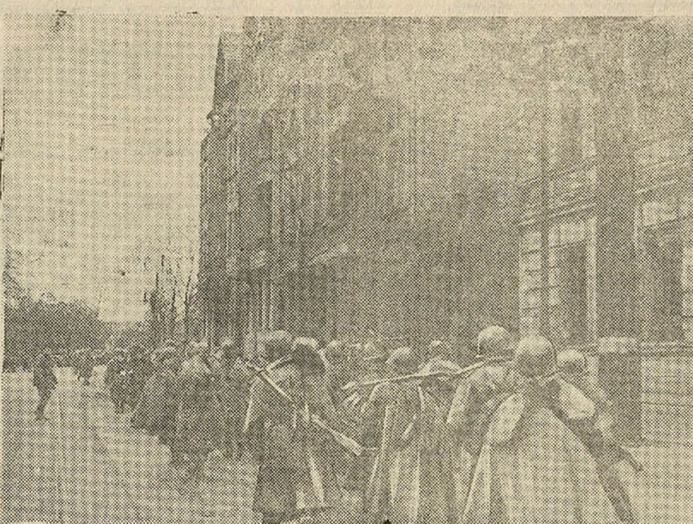
Савецкія войскі на вуліцах Берліна. (Фотакроніка ТАСС).

Вось урункі з гэтых лент (я нічога не маю і не даю): — У мяне сшынае на Осло. — Вельмі шкада, але мы больш не перадаем. Усе пакталі. Я апошні. Праз некалькі гадзін закрываю сувязь. — Хіба ў Берліне няма нікога, хто-б мог адказаць з курэрам? — Нажал, няма. — Божа мой, што робіцца, даваяліся... — Увага! У мяне маланка для вярхоўнага камандавання ўзброеных сіл заходнага аддзела генерал-лейтэнанту Вістэра. — Мы больш не прыяем. — Чаму? — Я сказаў, што не прыяем, і для вас дастаткова. Усе змысла. Я не магу кожнаму расказаць палы раман... — Я-б хацеў ведаць, якое ў вас становішча. — Выдатнае, як заўсёды. Пацягваючы ты на мяне — я сяджу ў поўнай ваеннай форме з аўтаматам. Усе ўпаклі, я тут апошні. Настрой ніжэй нуза. — Ну, а ў Берліне настрой добры? — Вядома, добры, як заўсёды. Кожны марыць аб мясе і катле, а ў мяне пятля на шыі. — Есьць у вас сувязь з Прагай?