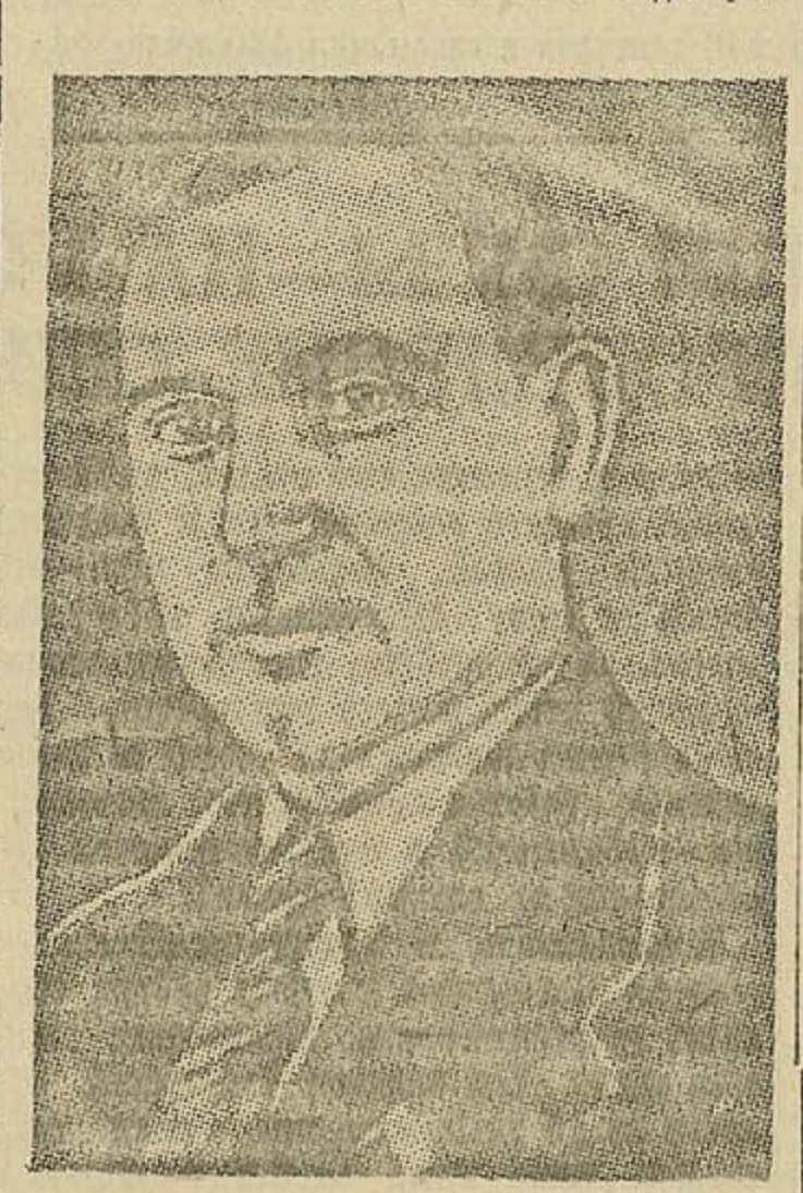
Н. Я. НАТАЛЕВИЧ

смотрение и утверждение сессии Верховного Совета СССР в сумме 305.251.754 тыс. руб., предлагаю утвердить. Государственный бюджет отражает непоколебимую волю и чаяния всего советского народа—скорее покончить с ненавистным врагом. Важнейшей статьей бюджета этого года являются военные расходы, которые предусматриваются бюджетом СССР на 1945 год в раз-