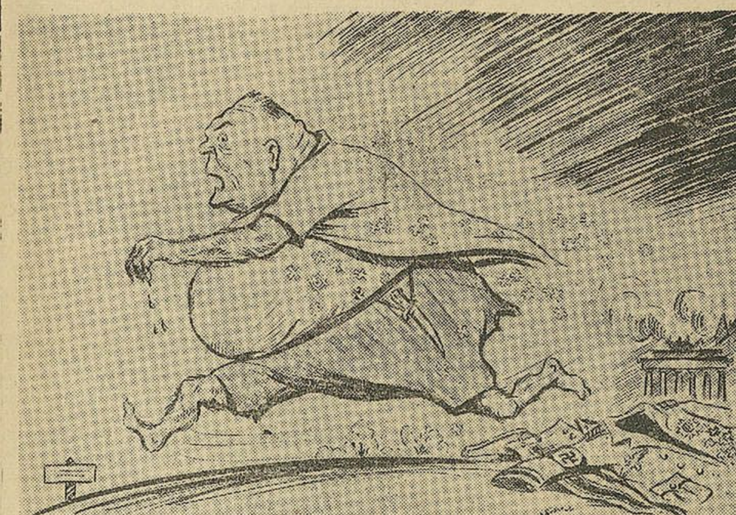
Рис. Л. БОЙКО.

Он, говорят, «ушел» в отставку. Но вот вопрос: в какую ставку? Хамелеон, «меняя вид», От павли в уясе бегит