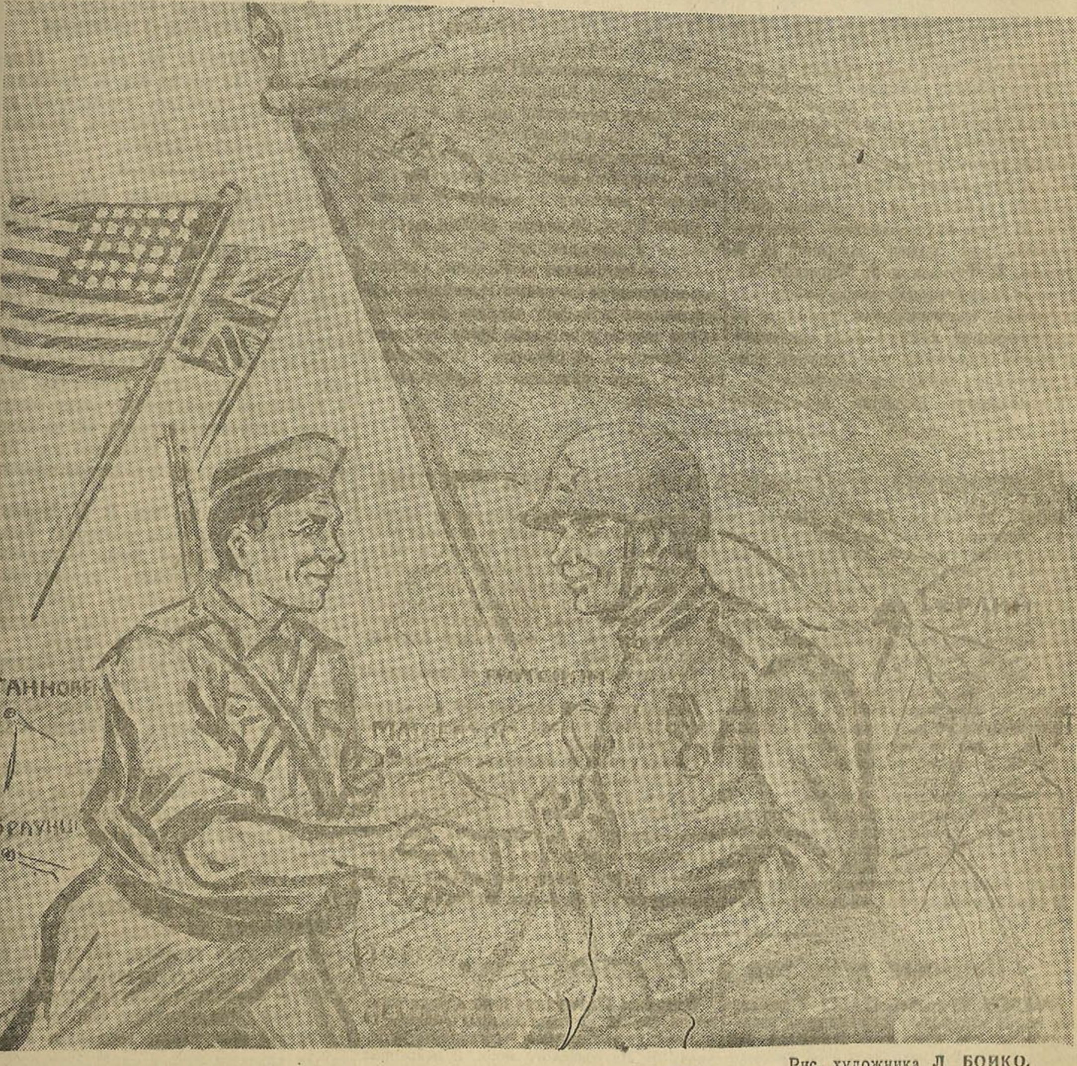
Рис. художника Л. БОЙКО.

Полное окружение Берлина, соединение войск союзных держав с Красной Армией в центре Германии вызвали радость и ликование трудящихся республики