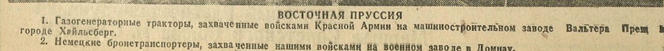
1. Газогенераторные тракторы, захваченные войсками Красной Армии на машиностроительном заводе Вальтера Преш в городе Хейльсберг. 2. Немецкие бронетранспортеры, захваченные нашими войсками на военном заводе в Домнау.

В. ШИЛКИН, Действующая Армия, 27 апреля. (Слеп. корр. ТАСС)