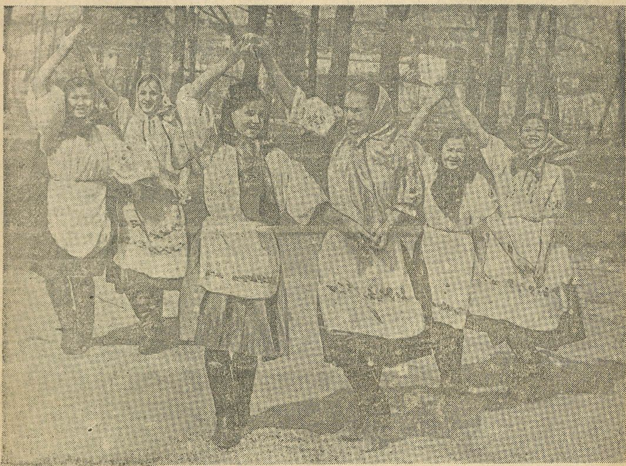
Танец «Лявониха», в исполнении колхозниц колхоза им. Сталина, Полесской обл.