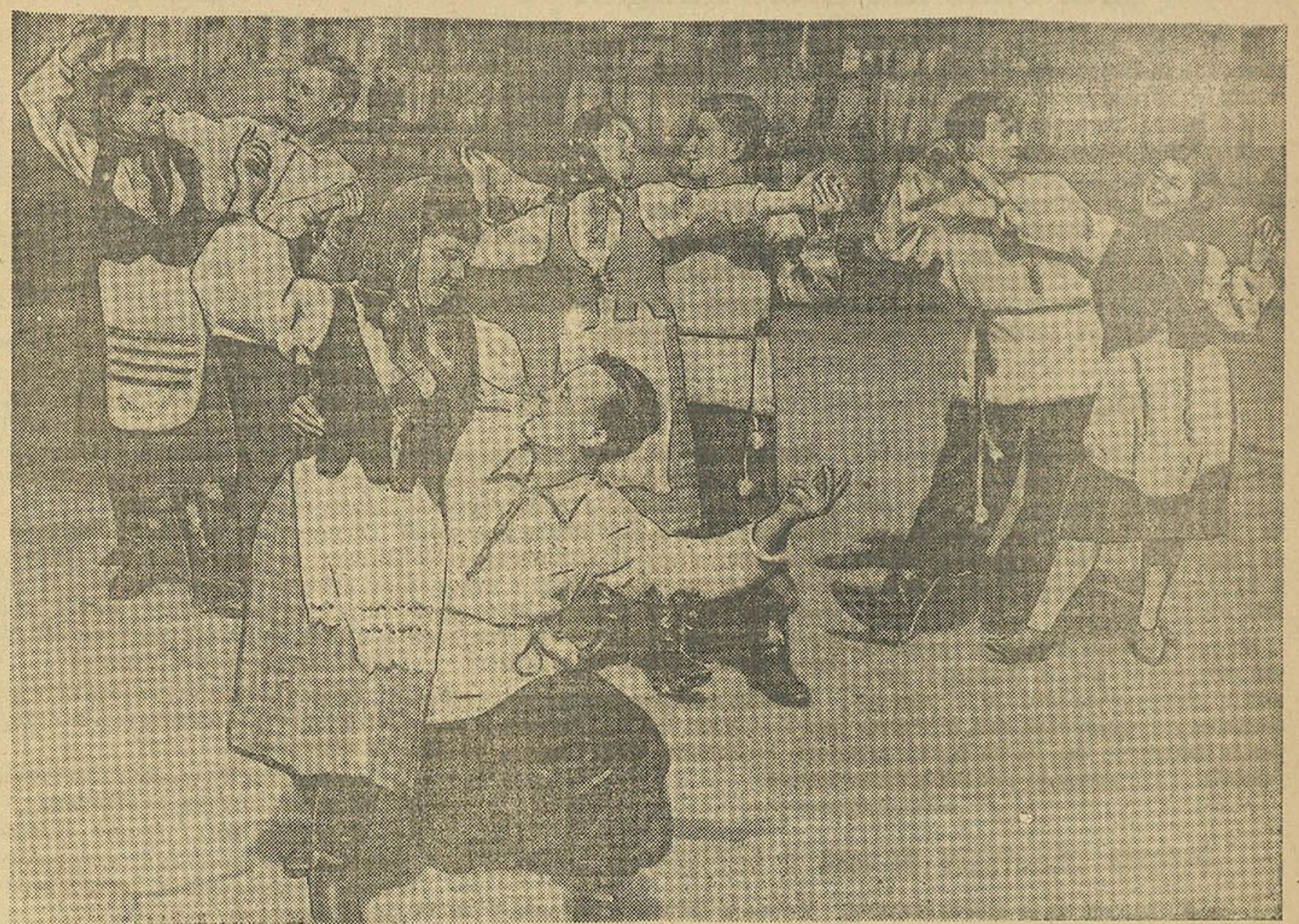
Танец «Крыжачок» в исполнении бывших партизан Молодечненской области.