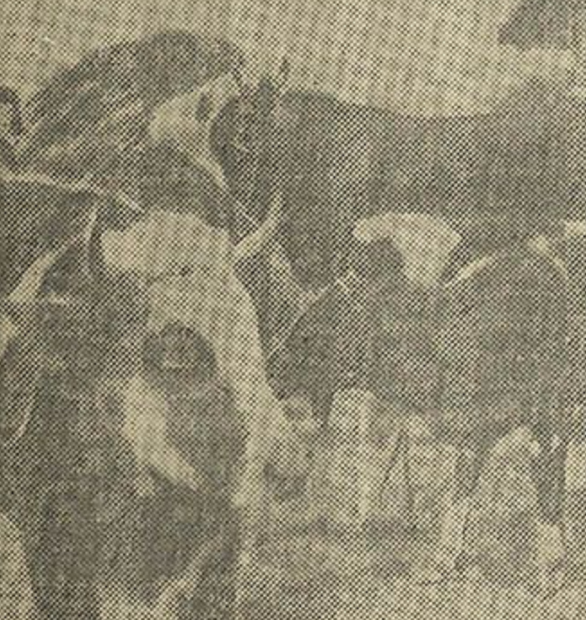
НА МАЛОЧНА-ТАВАРАНАЙ ФЕРМЕ. Калгасны статак пасля вадапою.