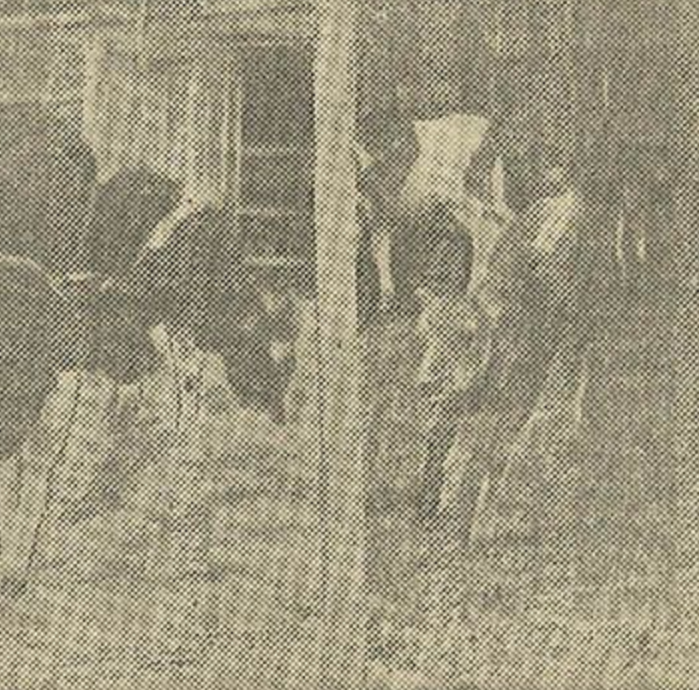
У ПЯЛЯТНІКУ. Першы прыклад — калгасныя цяляты на прагулцы.