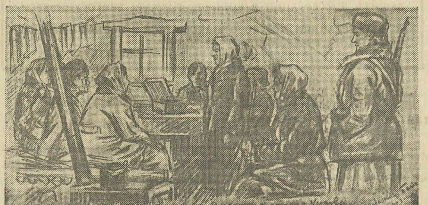
День 8-го марта в партизанском отряде им. Кирова. Минская область, 1943 год. Рис. художника Л. БОЙКО.

— Вот за этим холмом сейчас же дорога будет,—объявил командир. Здесь недалеко, справа—деревня Липинки, слева