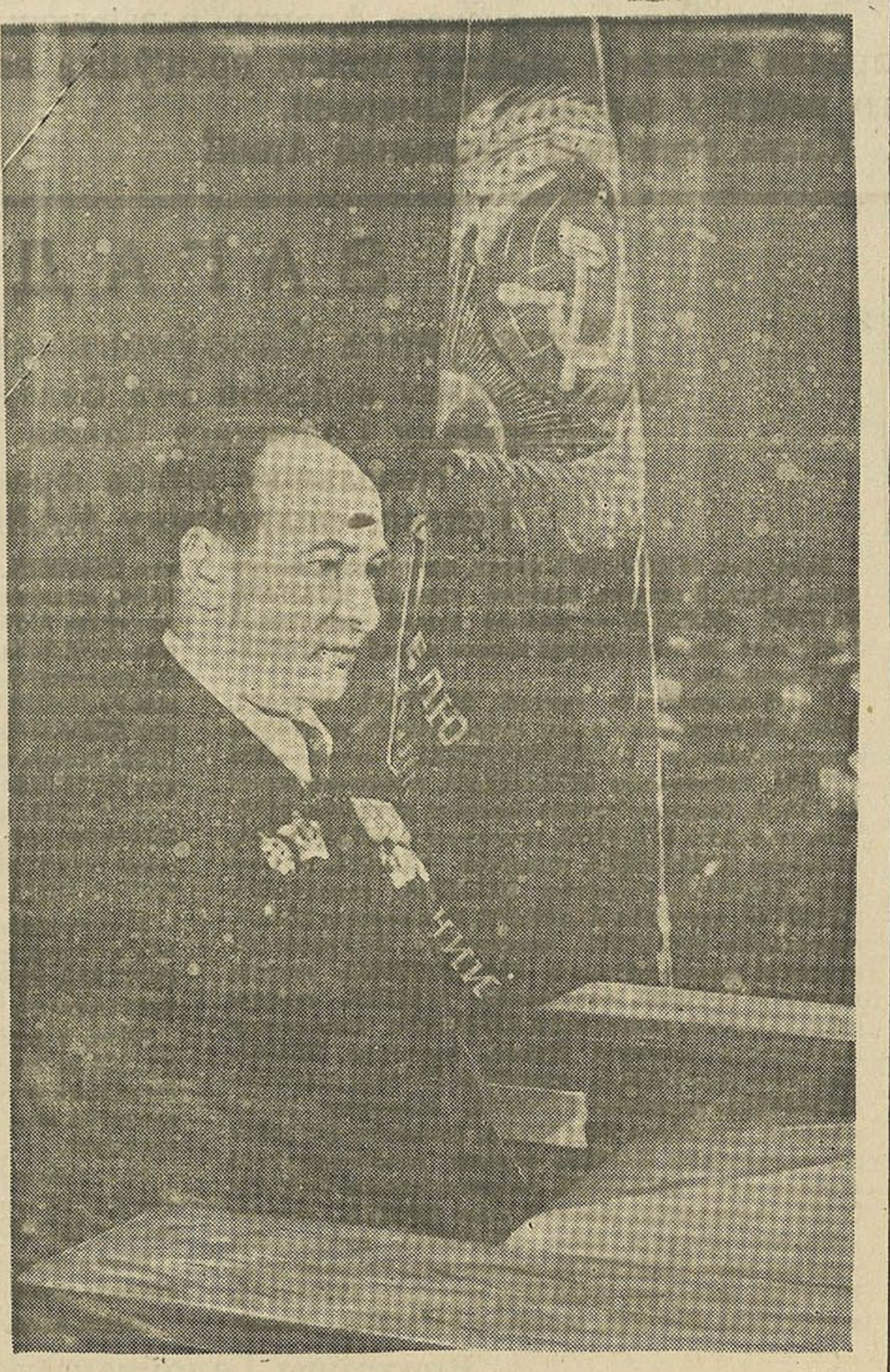
Выступленне Старшыні СНК Беларускай ССР і сакратара ЦК КП(б) таварыша П. К. Панамарэнка на нарадзе перадавікоў па рамонту трактараў.

Пад урачыстым гукі Гімна Савецкага Саюза, гвардыі генерал-маёр Глебаў уручае Пераходны Чырвоны Сцяг Дзяржаўнага Камітэта Абароны Старшыні Савета Народных Камісараў Беларускай ССР і