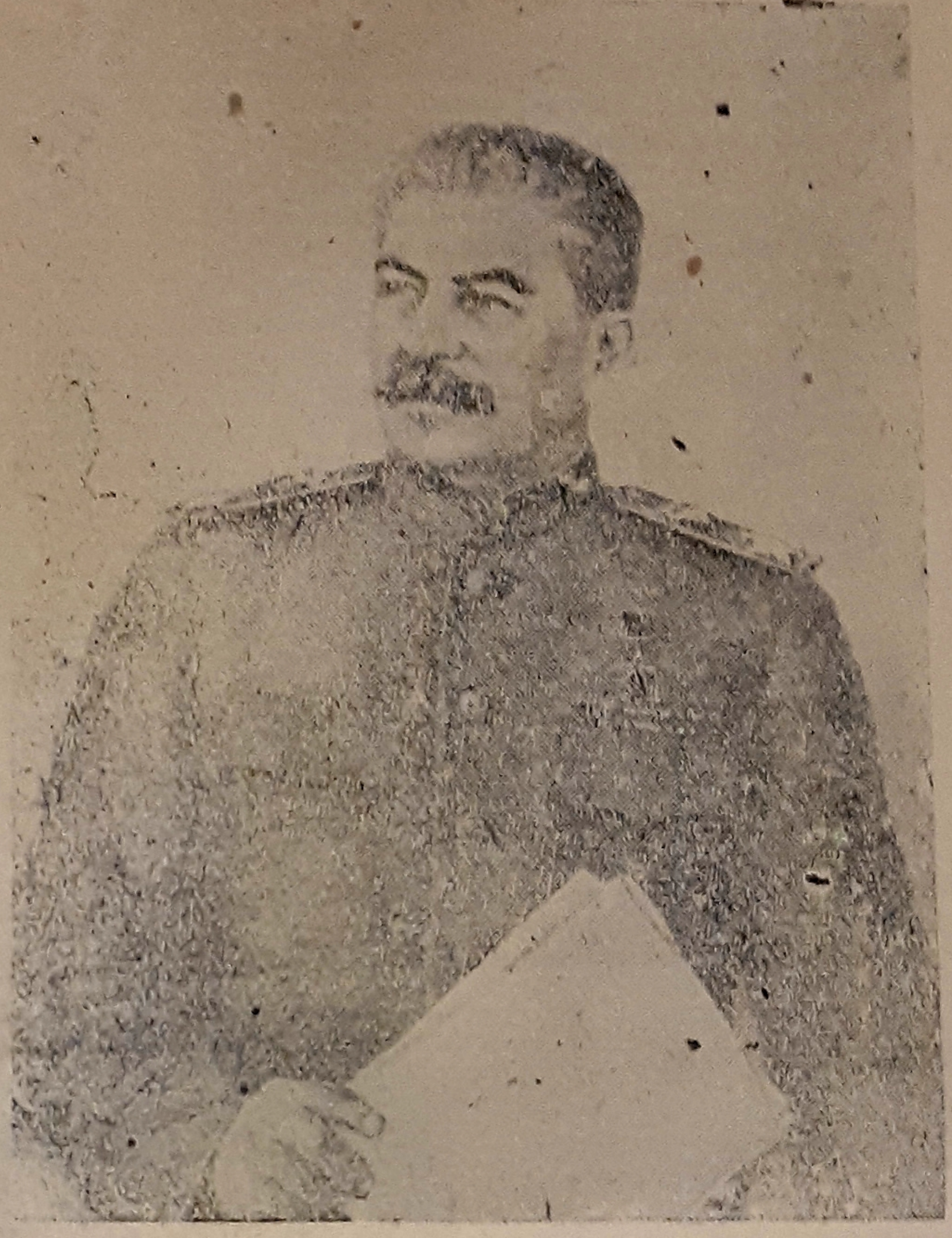
БЯРХОЎНЫ ГАЛОЎКАМАНДУЮЧЫ МАРШАЛ СОВЕЦКАГА САЮЗА І. В. СТАЛІН.

Аператыўная зводка за 21 лютага У працягу 21 лютага на Зем-Кірхеніян, Оссік, Оццлель, Шёнберг. У правінцы Брандэнбург нашы войскі з боем авалодалі гарадамі Ціфегген, Прибузе, і таксама занялі больш 50 другіх населеных пунктаў, у тым ліку буйныя населеныя пункты Ламо, Кутэра, Фарштадт, Геррэн, Шверле, Цешхелн, Грэфенхайн, Гросс-Зельтэн, Лайпца. У баях за 20 лютага ў гэтым раёне нашы войскі адбілі і знішчылі 40 нямецкіх танкаў. У раёне Брэлау нашы войскі занялі баі па знішчэнню акружэнняў у горадзе групіроўкі праціўніка. На паўночным беразе Дуная, на усходзе ад горада Камарно, атакі пяхоты і танкаў праціўніка адбіваюцца нашымі войскамі. 20 лютага ў гэтым раёне падбіта і знішчана 38 нямецкіх танкаў і самаходных гармат. На другіх участках фронта — пошукі разведчыкаў і у раёне пунктаў баі мясцовага значэння. За 20 лютага на ўсіх франтах падбіта і знішчана 180 нямецкіх танкаў і самаходных гармат. У паветраных баях і агнём знішчана артылерыі збіта 67 самалётаў праціўніка. У баях за 20 лютага на захадзе і паўднёвым захадзе ад Ке-берга падбіта і знішчана нямецкіх танкаў і самаход-гармат. У раёне 2-га Беларускага фронту, прадаўжаючы наступ, 21 лютага з боем авалодалі гарадамі Чэрскі — важным пунктам камунікацыі і моцным пунктам абароны немцаў у паўночна-заходняй частцы Італіі, а таксама з баямі адбілі больш 40 другіх населеных пунктаў, сярод якіх буйныя населеныя пункты Езэвіц, Сфельдэ, Пескерфэльдэ.