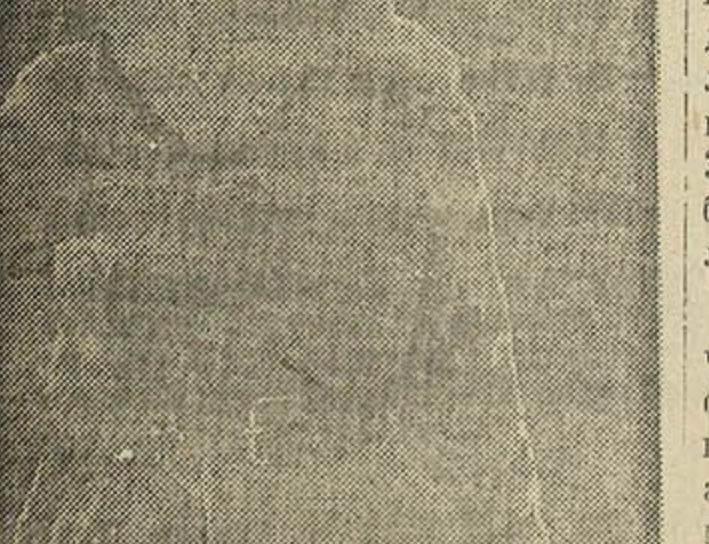
2-й Прыбалтыйскі фронт. Значны снайпер і старшыня Пётр Сергеевіч Галавін. За час вайны ён знішчыў 460 немцаў.