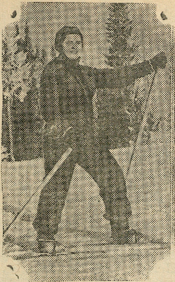
У калгасе Удмурыцкай АССР ідуць лыжныя спарбніцтвы.