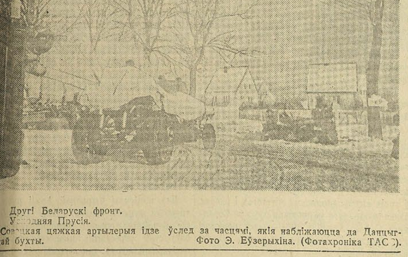
Другі Беларускі фронт. Уважліва Прусія. Савецкая цяжкая артылерыя ідзе ўсперад за часцічкі, якія набліжаюцца да Ланцхутскай бухты.

ПЯТРО ГЛЕБКА На зарослым травой пакарышчы, Толькі зорак запаленча крылом, Зноўчы пілы, гулуды таварышчы, Стогне дрэва — будзецца дом. Рэзніваччы дужыя рукі, Прадавітыя людзі ў лесах Смалягі гэтага зводу і груку, Смавалі аб ім па начах. Сцяганы, распілюшчыкі, дэслы, Палкадаючы міны і толы, Гэту снагу наўтоўную неслі Да разбураных вёсак і сёл. На сцягані зчыліва і дбайна Падзямае на працу яна, Бо жыць між таварышаў тайна Занаветная думка адна. Дачакаемся мы перамогі, І відоўга, здаецца, чакаць. Прыдуць хлопцы з далёкай дарогі — Трэба-ж будзе іх недзе прыняць. Трэба так, каб яны пры сустрачці У цяпле расправудзіла маглі, На абжытай, нацеленай пачы Прасушылі свае шыялы. Мір-жа новаму, цёпламу дому! Слава добрай будаўніцкаму, Клапатліваму сэрцу людскому І людскім клапатлівым рукам! 1945 г.